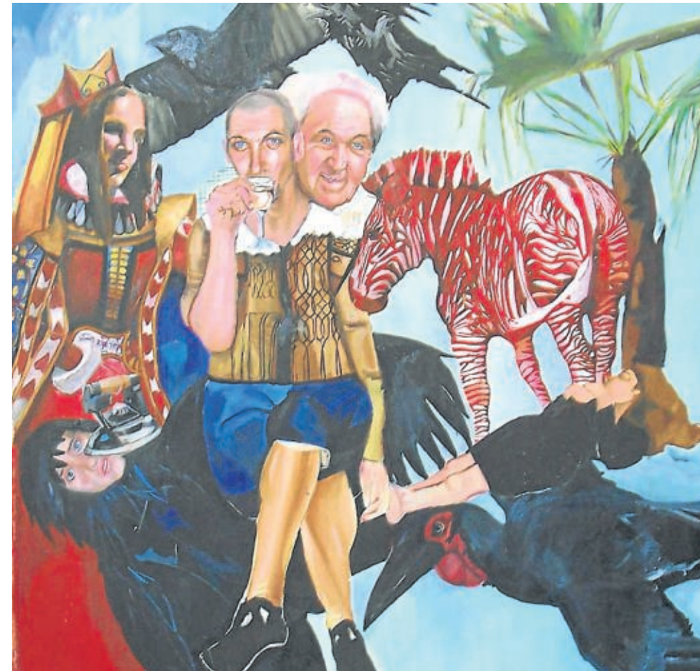
Die Arbeiten der kroatischen Künstlerin Zoe Gugliemi erinnern laut des internationalen Kurators Adam Budak an den magischen Realismus KK (4)

In Villach kommen mit dem Atelier Anita Wiegele, dem Atelier Tragauer, der Galerie Markushof und dem Kulturraum Westbahnhof Tabea gleich vier neue Schauplätze dazu. Im Kunst.Raum Villach am Hauptplatz kommen heuer auch die Kinder auf ihre